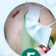
右手按住口罩 左手将护绳绕 在耳根部