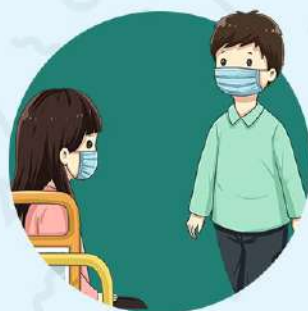
公交上 戴口罩 不乱碰 不乱摸